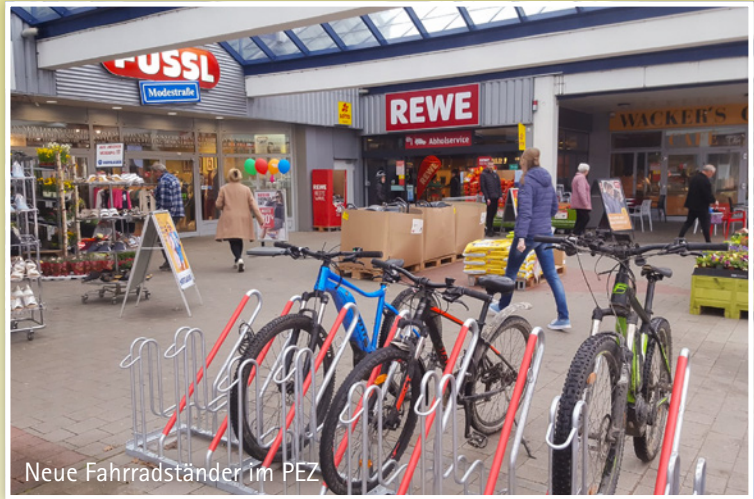
Neue Fahrradständer im PEZ

Diese Entwicklung lässt hoffen. Das PEZ möchte Ihren Besuch noch angenehmer gestalten, indem es Ihre Wünsche und Anregungen aus der großen Meinungsumfrage so weit wie