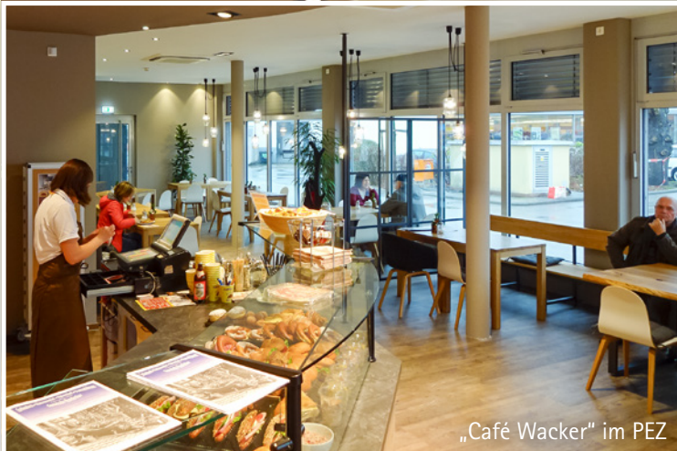
„Café Wacker“ im PEZ

möglich umsetzt. Drei kleinere Punkte möchten wir Ihnen schon einmal vorstellen: Zum einen wurde mehrfach die Installation eines Fahrradständers unter dem Vordach von „REWE/Fussl“ gewünscht. Ebenso wird das Café der „Bäckerei Wacker“ im Außenbereich mit attraktiven Pflanztrögen verschönert und wieder eine zweite Kasse direkt im Café eingesetzt. Das Anstellen für einen Cappuccino, ein Sandwich oder einen Kuchen an der großen Verkaufstheke in der Nähe der REWE-Kassen entfällt somit.