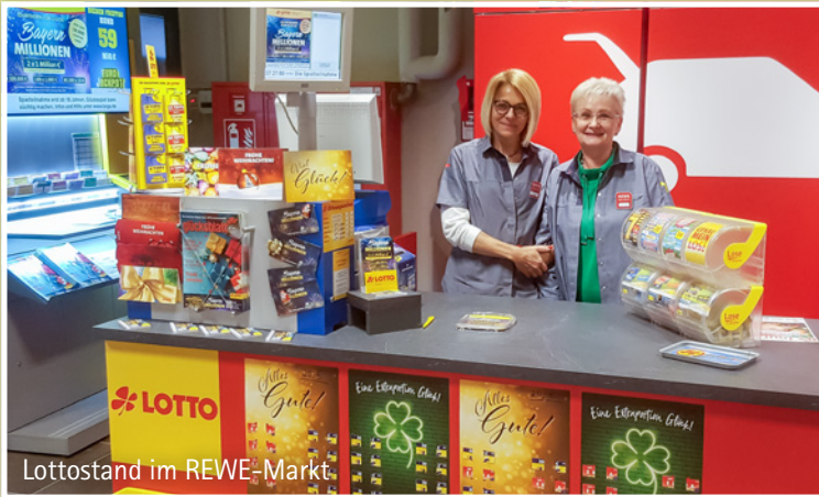
Lottostand im REWE-Markt.

Im PEZ Hohenstadt gibt es neben den verschiedenen Einkaufsgeschäften, dem großen Gesundheitszentrum und den gastronomischen Betrieben auch eine Kita. Direkt oberhalb des „dm-Marktes“ befindet sich die Kleinkindgruppe Grashüpfer der Kita „HaWei“. Hier werden 1- bis 3-jährige Kinder immer montags bis freitags von 7 bis 15 Uhr betreut. Und es gibt noch freie Plätze. Wenn Sie Bedarf an einer Kinder-Betreuungsmöglichkeit haben, können Sie sich gerne an die Leiterin Frau Haas wenden. Alle weiteren Infos finden Sie in der Anzeige auf der Rückseite.