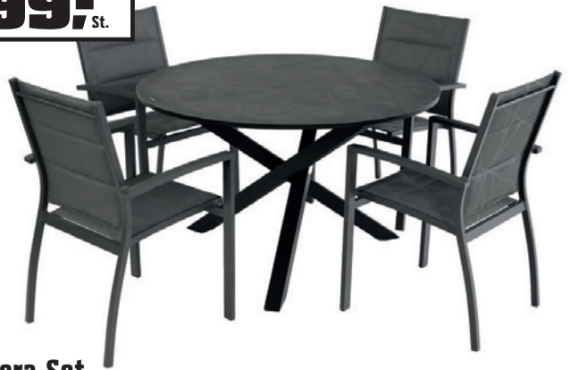
Baltimore-Set 5-teilig, Anthrazit, Tisch Ø 120 cm, Art.-Nr. 7437106