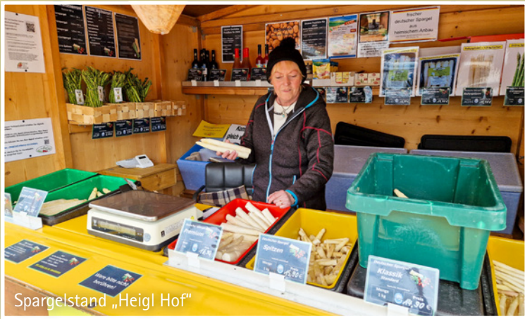
Spargelstand „Heigl Hof“