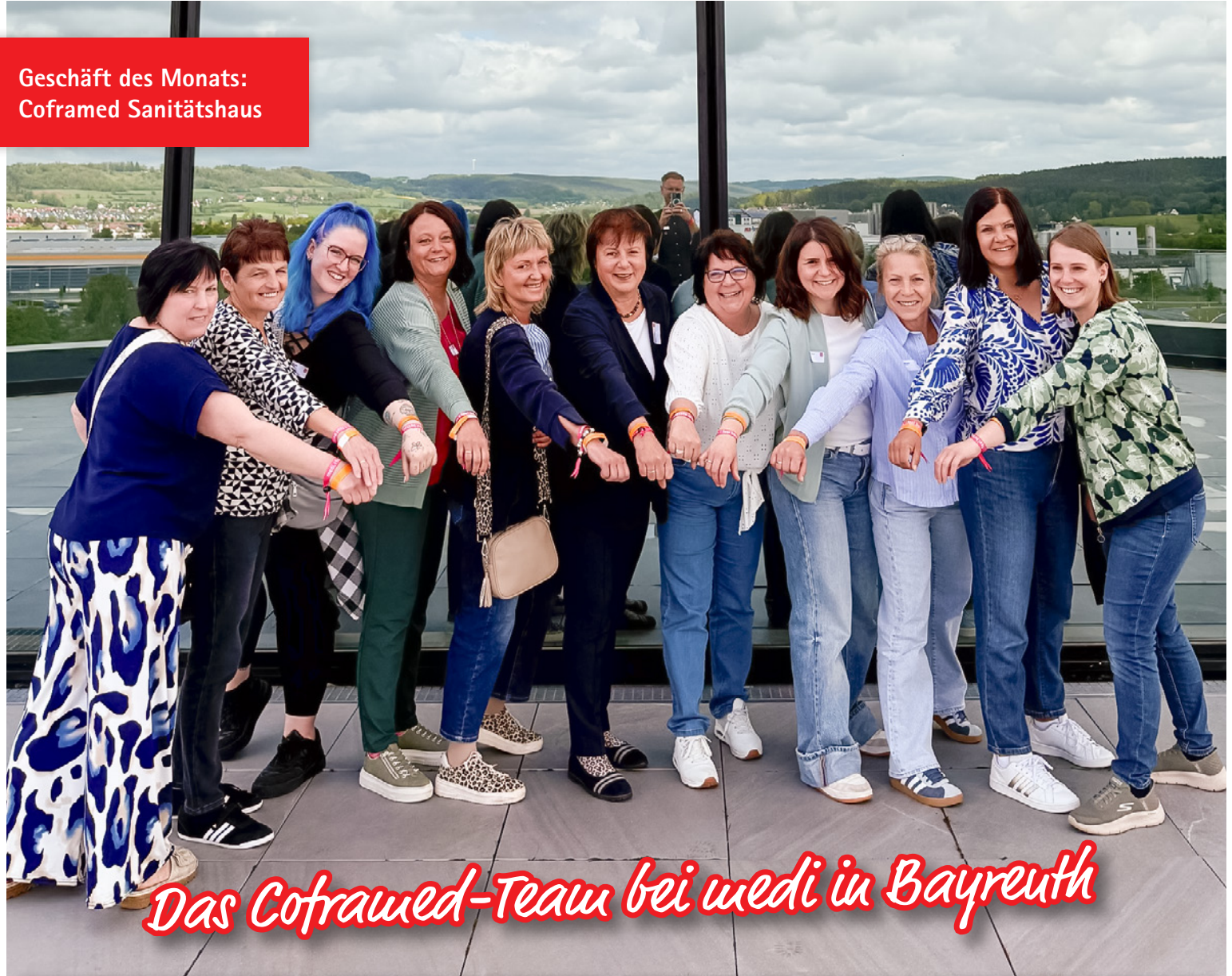
Das Coframed-Team bei medi in Bayreuth

Geschäft des Monats: Coframed Sanitätshaus